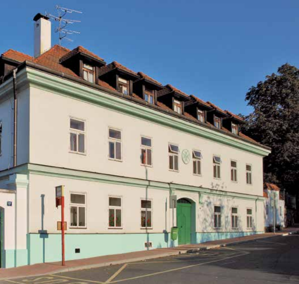
Hospic Štrasburk v Praze-Bohnicích.

ného života. Málokdy se obrací na rodinu nebo personál," říká Vojtěch Eliáš, biskupský vikář pro diakonii v pražské diecézi. „Naopak v hospici musíte vzít v potaz nejenom umírajícího, ale také příbuzné, rodinu a okolí celkově, které si začíná uvědomovat brzkou ztrátu blízkého člověka.“ Tuto zkušenost mi potvrzuje i otec Kofroň. „Někdy se u příbuzných setkávám s hrůzou i z pouhého setkání s umírajícím. Nemusí to být způsobeno jen obavou ze setkání se smrtí, ale např. také z výčitek a nevyřešené minulosti,“ dodává kněz a vzpomíná na příběh dívky, která svou umírající matku navštívila až po třech měsících a maminku se zdráhala být jen spatřit i ve chvíli, kdy jí zbývaly poslední hodiny života. „Dívka se tím trápila natolik, že se ani neodvážila do pokoje vstoupit. Nepodařilo se mi ji přesvědčit, že je ještě čas k nápravě,“ vybavuje si kněz jeden z mnohých příběhů, se kterými se ve svém životě setkal.