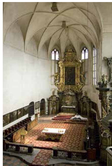
Kostel Všetech svatých.