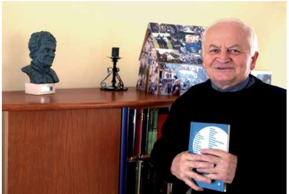
Biskup Karel Herbst.

Když sleduji dobře naladěného pana biskupa, napadá mě, že jeho život nebyl jednoduchý. Kněžské svěcení přijal v roce 1973, už v roce 1975 mu byl odňat státní