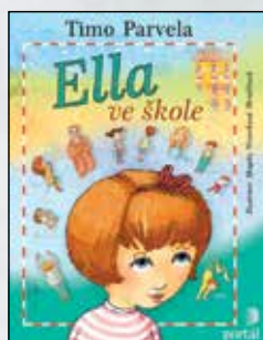
ELLA VE ŠKOLE Timo Parvela Váz., 120 str., 235 Kč