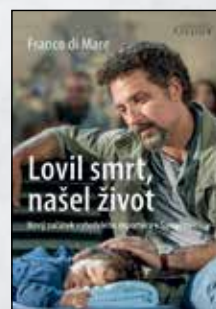
LOVIL SMRT, NAŠEL ŽIVOT Franco di Mare Brož., 224 s., 349 Kč