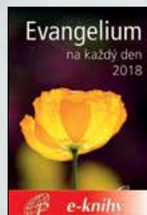
EVANGELIUM NA KAŽDÝ DEN 2018 E-kniha, 99 Kč