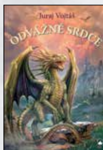
ODVÁŽNÉ SRDCE Juraj Vojtáš Brož., 304 s., 349 Kč