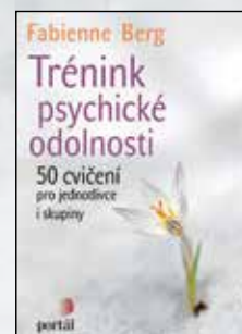
TRÉNINK PSYCHICKÉ ODOLNOSTI Fabienne Berg Brož., 120 str., 199 Kč