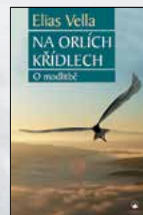
NA ORLÍCH KŘÍDLECH Elias Vella Brož., 204 s., 269 Kč