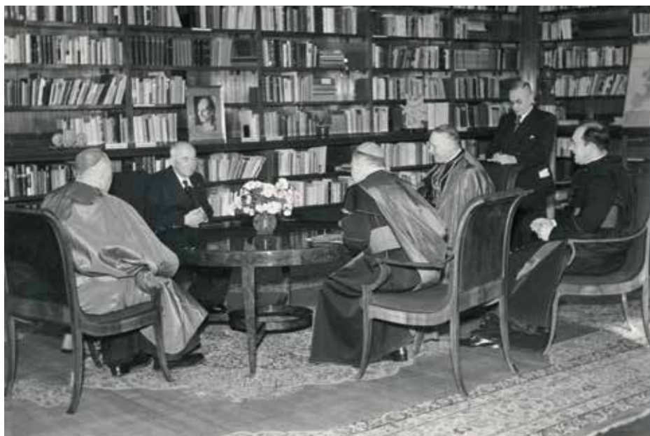
Kardinál Beran s prezidentem Benešem.

V osudech pražského arcibiskupa Josefa Berana najdeme totožné momenty s osudy jiných primasů ve státech střední Evropy, jež se ocitly pod komunistickou mocí. Všichni podstoupili těžkou zkoušku opravdovosti své víry v podmínkách nástupu nových komunistických režimů, které považovaly katolickou církev za jednoho z největších ideových protivníků. To platí jak pro Poláka Wyszyńskiego, tak i Maďara Mindszentyho. Přestože byli primárně duchovními pastýři, doba je vystavila překotně se valícím politickým událostem. Beranův příklad je však v mnohém specifický.