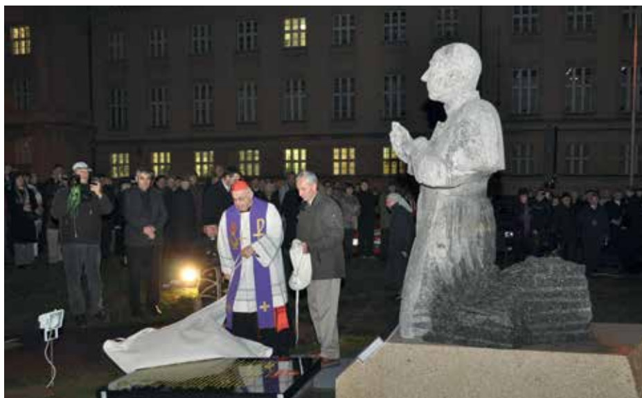
Odhaltání pomníku kardinála Berana.