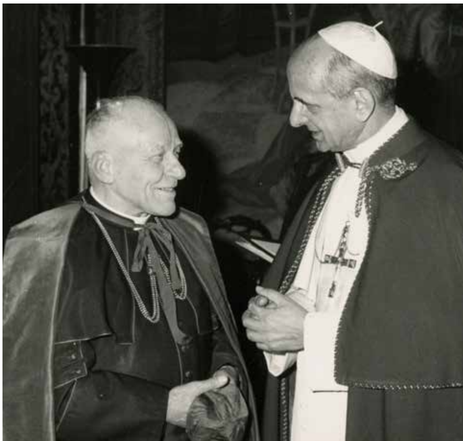
Kardinál Beran s papežem Pavlem VI.