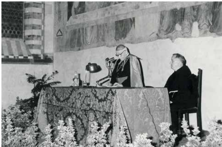
Kardinál Beran přebírá čestný doktorát.

„Všechny vlády tohoto světa katolická církev naléhavě prosí, aby zásadu svobody svědomí účinně rozšířily na všechny občany, tedy i na ty, kdo věří v Boha, a aby přestaly jakýmkoliv způsobem utiskovat náboženskou svobodu. Ať jsou nejdříve osvobozeni všichni kněží i prostí věřící, kteří jsou po tolika letech stále ještě ve vězení pro svou náboženskou činnost, třebas i pod různými záminkami. Biskupům a kněžím, kterým se v tak velkém počtu zabraňuje vykonávat svůj úřad, ať je dovoleno, aby se ujali zase duchovní správy svých věřících. Kde je církev nespravedlivými zákony vydána na milost zvůli úřadů sobě nepřátelských, tam ať je obnovena její vnitřní samospráva a je usnadněno její spojení s Petrovým stolcem. Ať zmizí překážky, které brání dosažení kněžství nebo řeholního života. Duchovním řádům a kongregacím bratří a sester ať je opět dovolen společný život. A konečně všem věřícím necht' je zajištěna účinná svoboda vyznávat víru, zjevené pravdy šířit a vykládat a ve víře vychovávat děti. Tak vykonáme pravé dílo míru, v naší době nanejvýš potřebné.“