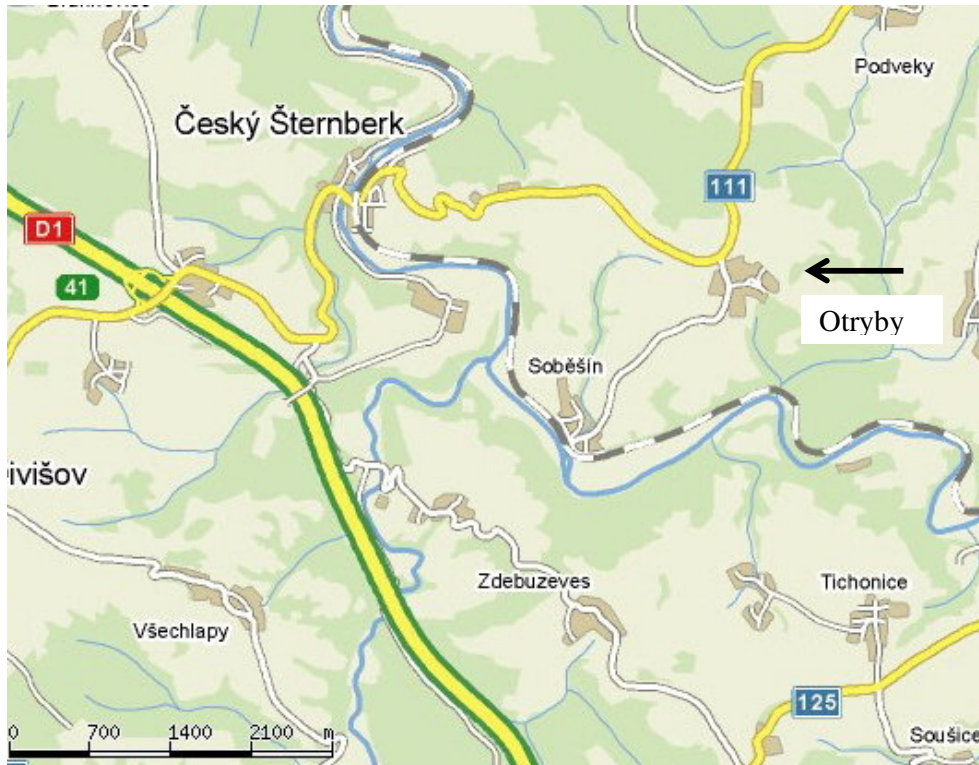
Příjezd od Českého Šternberka – silnice č. 111